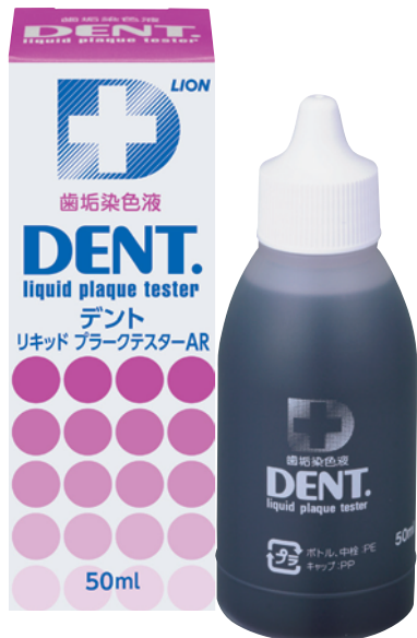
DENT.リキッドプラークテスター(50ml)