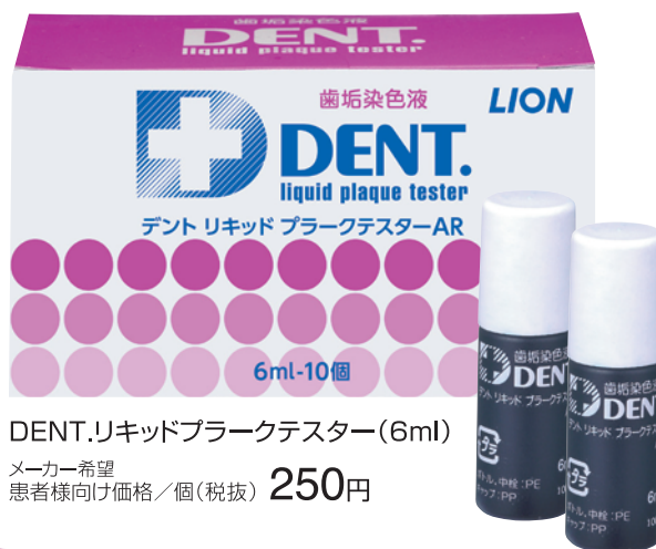
DENT.リキッドプラークテスター(6ml)