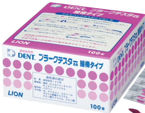
DENT.プラークテスター綿棒タイプ(100本入)