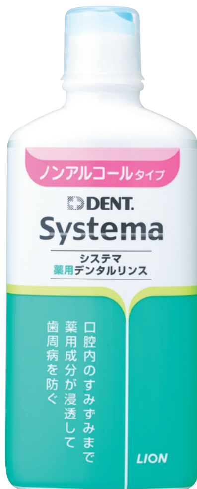
ノンアルコールタイプ (450ml)